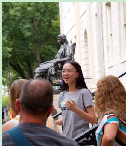
公共演讲与辩论综合课堂公开演讲活动